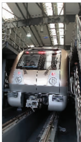
“土豪金”从城西路停车场出发