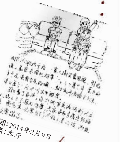
时间:2014年2月9日 地点:客厅