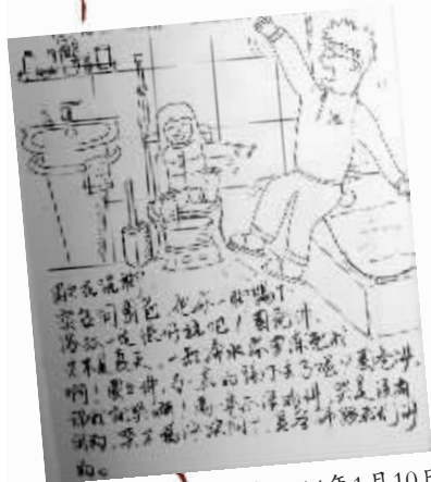
时间:2014年1月10日 地点:家里浴室

最近,圈爸将自己的部分作品发上网络,温馨的画面,加上平实而细腻的文字,顿时在网友中引发一阵不小的轰动。“这位家长太有才了吧”“女儿太可爱了,萌哭”“每一张画,满满都是爱啊”……因为圈爸在每一幅图画下,都特意用毛笔写下“图片说明”,这甚至还激起无数网友购买冲动,“太美了,请问本子和笔哪里可以找到?”