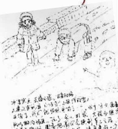
时间:2014年2月19日 地点:马路上