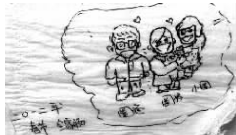
第一幅关于女儿的漫画