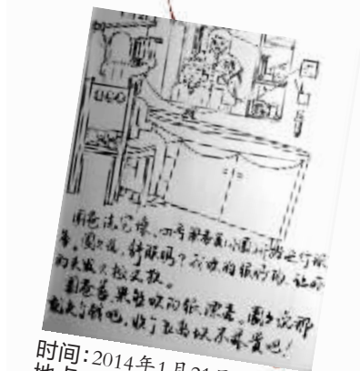
时间:2014年1月21日 地点:家里浴室