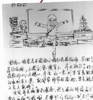
时间:2014年2月17日 地点:客厅