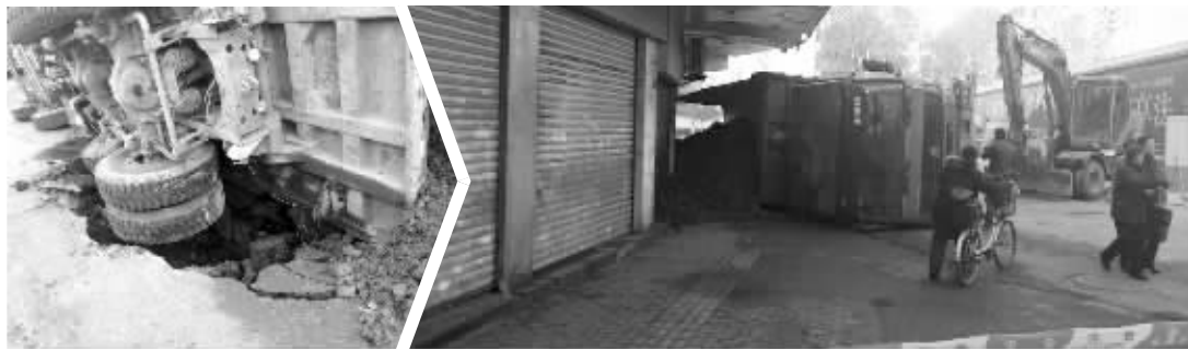
路面塌陷,渣土车侧翻,渣土堵了路边小吃店