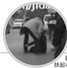
姜先生拍下了好心人扶起老奶奶的一幕