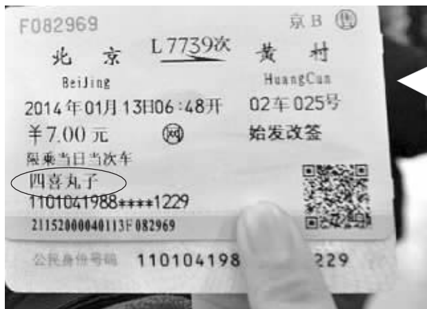
3月1日起,这样的化名购票行不通了

详情请登录www.12306.cn网站查看《铁路互联网购票身份信息核验须知》,铁路部门欢迎广大旅客对12306网站功能完善工作提出意见建议。 据新华社