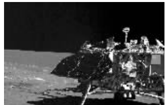
“玉兔”搭载的全景相机(左相机)获得的着陆器及月面彩色图像

记者从国防科工局获悉,23日凌晨,嫦娥三号着陆器再次进入月夜休眠。此前,“玉兔”号月球车于22日午后进入“梦乡”。