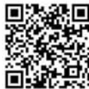
现代快报记者 花梓 滑冰表演

现代快报记者从活动上了解到,昨天20点14分,青奥会开闭幕式门票开始在青奥官网( http://www.nanjing2014.org/cn/ )接受公众预订。开幕式门票价格在600元—3200元,闭幕式门票价格在500元—2800元,其中中低价票占了近三分之二。考虑到开闭幕式门票需求量会较大,此次也将借鉴亚青的模式,采取“先预订、再抽签”的方式,这意味着能不能买到票还得碰运气。现代快报记者 鹿伟