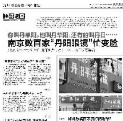
现代快报2月20日的相关报道