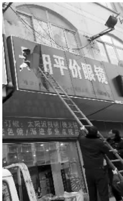
西善桥整治违规门头店招