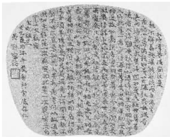
刘灿铭《金刚经选》小楷 18cmx23cm