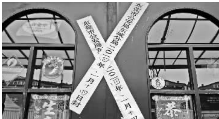
东莞东城酒吧街上的10家酒吧都被贴上封条关门停业

记者在现场看到,这一层的电梯口,已经被当地公安部门贴上了封条,4名派出所协警在该层值守,禁止任何人靠近。