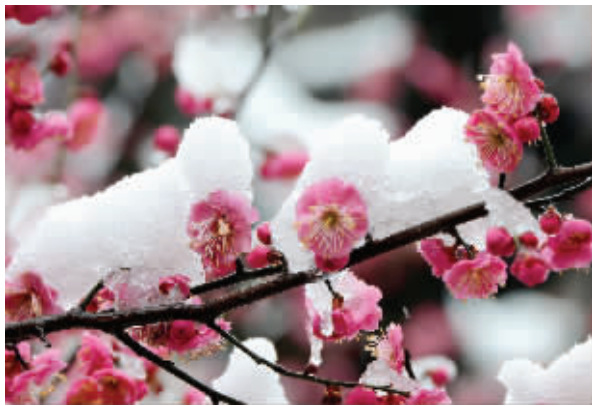
红梅傲立在雪中

昨天的梅花山,梅花和雪花一起盛放。一年一度的南京国际梅花节,也将闪亮登场!现代快报记者从南京国际梅花节新闻通气会上获悉,本届梅花节将于2月20日至3月31日在南京举行。花情预报员王峰告诉现代快报记者,紫金山上温度较低,预计明天开幕时,梅花山上仍有少量积雪,向往踏雪赏梅的亲们,千万不要错过哦! 现代快报记者 余乐