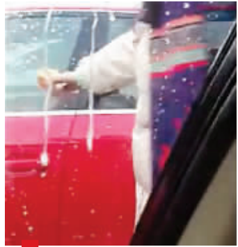
女子将饮料泼在对方车上