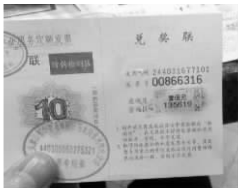
霍金Hawking:哈哈哈哈哈!我中了100块!我刮的!第一次!开心! 霍金Hawking:啊啊啊啊!到底是谁!!我都没来得及把这100块充话费 不知道被你们哪个混蛋给充了!!你给我出来!我要报警!我应该先充了再发微博的。啊啊啊啊,我的钱,抓狂! 纪少燕:蠢哭了。 (霍金Hawking微博)