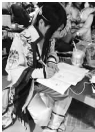
LC牛郎团_NO-13_培根:你不会懂在漫展等候间隙还疯狂赶作业的痛,认真做作业的二少你值得拥有。 动漫基地:感动中国好网友。 (LC牛郎团_NO-13_培根微博)