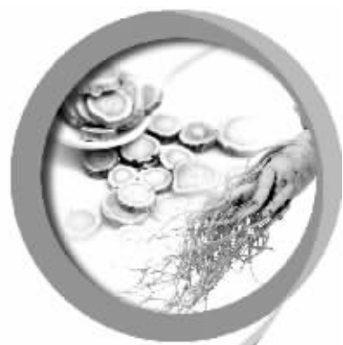
同时加用人参、黄芪等中药补气祛邪