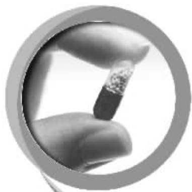
用达菲等西药治疗以及利用西医方法抢救