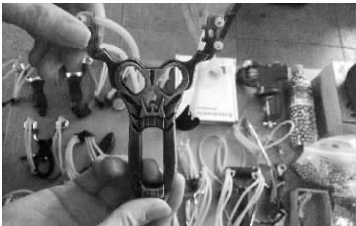
在江西南昌市花鸟市场的一个摊位上售卖的弹弓

记者调查发现:如今部分“弹弓族”以竞技为名,干的都是些危害他人人身财产安全、残害鸟类等小动物的不法行为,令人不齿。然而,对这些明显违法的行为,却似乎无人能管。