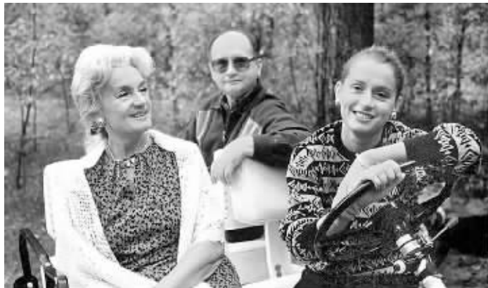
波兰前总统雅鲁泽尔斯基与夫人芭芭拉和女儿莫妮卡 资料图片

据《超级快报》等波兰媒体14日报道,现年91岁高龄的波兰前总统沃伊切赫·雅鲁泽尔斯基与84岁的夫人芭芭拉结婚近55年,在一般人眼中是位好丈夫、好父亲。令人匪夷所思的是,因淋巴瘤住院治疗的他近日却与一名50多岁的女护工在病房里偷情,不想被前来探病的老伴捉奸在床。怒不可遏的芭芭拉要求丈夫与“小三”一刀两断,否则将提出离婚!