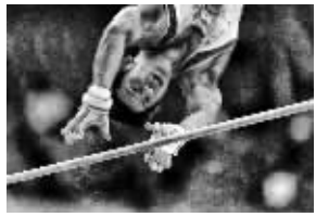
贾国荣:《杠上争夺战》