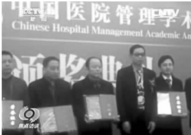
颁奖现场