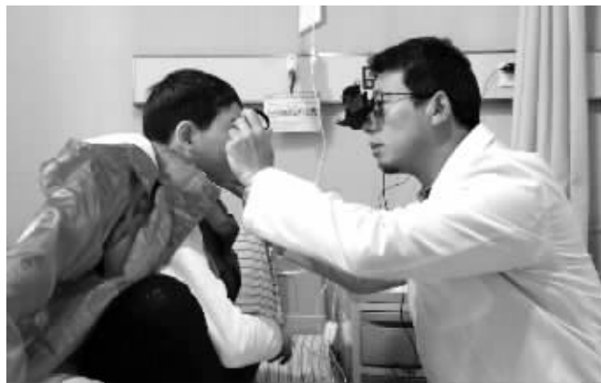
艳艳在医院接受检查