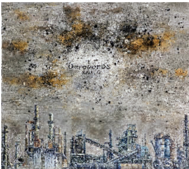
“蛇尾街 No.10”综合媒介,180cmx160cm,2012年