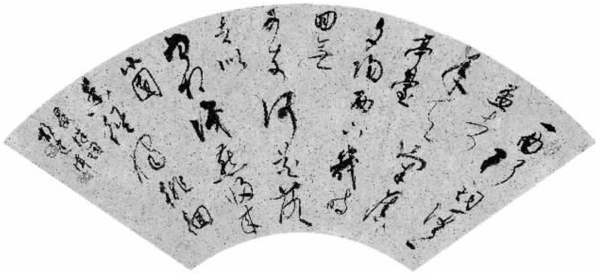
本版均为郁建伟书法作品