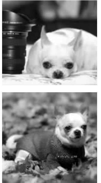
360°无死角帅哥毛毛落叶写真照

去年7月份的时候, 我们一家三口去云南旅游, 把它送到我妈妈家代为照顾, 结果我们离开的10天里, 它几乎没怎么吃东西, 瘦了一大圈。等我们回来才开始好好吃饭。但是因为我们的离开, 它生了好久的气,