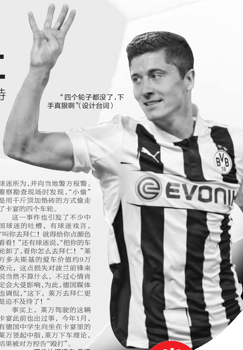
“四个轮子都没了,下真狠啊”(设计台词)