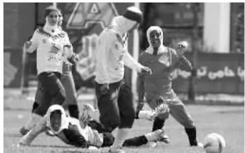
右边的“女球员”,怎么看都像男人

近日,伊朗女足爆出性别闹剧:联赛中查出7名男球员,就连伊朗女足国家队里也有4个男人……目前,这些问题球员已自动终止了与俱乐部的合同,而4名国脚也被国家队开除。