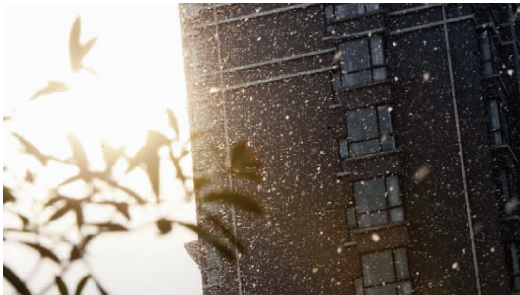
昨天, 南京飘起太阳雪, 令市民好奇不已

太阳当头照, 雪花空中飘。昨天, 江苏多地出现同样的景象——太阳雪。今天, 雨雪天气间歇, 但气温仍比较低, 淮北最低-6℃, 南京最低-4℃, 明天开始气温逐步回升。但明天开始, 雨雪天气重返江苏, 这个周末, 很可能也躲不开降雨的烦扰。 现代快报记者 刘伟伟/文 赵杰 顾炜 徐洋/摄