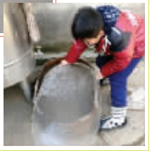
盆里的水结成的冰有1厘米厚