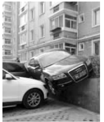
这辆奥迪车竟然上了墙

在图片中,这辆黑色奥迪硬生生地“被攀岩”了。一辆白色的轿车霸气挤推,黑色奥迪被挤压到了小区墙壁外侧。昨天,网友“@W实拍车友”发出微博,图片中,一辆黑色奥迪侧身悬挂在小区外围墙壁上,在白色轿车和旁边一辆银灰色车辆的围绕下,这辆奥迪悬挂着并没有掉落下来。昨天下午,记者与网友@W实拍车友联系上,他告诉记者,这张图片是别人转给他的,自己并不清楚发生在哪个小区。不过他说,根据车牌号,可以确认奥迪车是扬州的。现代快报记者在图片上