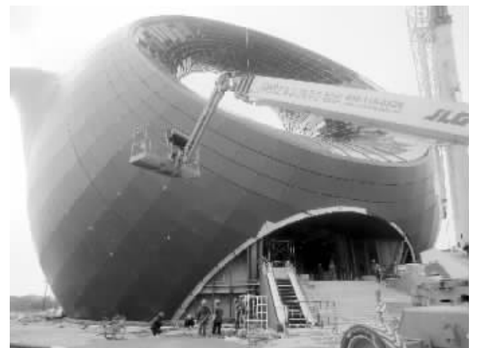
巨型紫砂壶建筑其实是多功能展示中心

快报讯(记者 薛晟)远看是巨型紫砂茶壶,近观是构思精妙的展示馆。昨天下午,记者在位于无锡市滨湖区蠡湖大道和具区路附近看到,一个巨大的紫砂茶壶形状建筑物已经进入外观的幕墙安装阶段。据悉,最早在2月28日,这一独具特色的紫砂茶壶形建筑将建成,今后将成为万达文旅城项目的多功能展示中心。