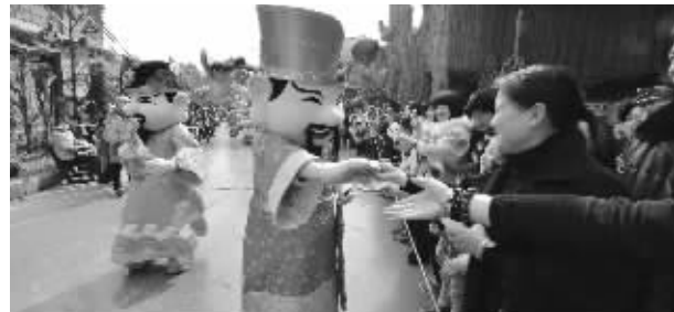
恐龙园内福禄寿喜财路秀,吸引游客围观