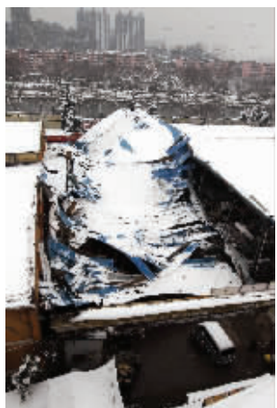
被大雪压塌的农贸市场大棚

2月5日,徐州普降大雪,当晚9时许,市区黄河北路老牌楼农贸市场,约500平米大棚在大雪中倒塌。目前尚未发现人员伤亡,不过不少市场业主的货物被砸,市场管理方正组织人力进行善后处理。