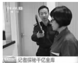
进金库前全身要检查