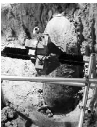
发现炸弹的地基挖掘现场

经检查,炸弹引信仍然存在,炸药仍然有效,警方人员不敢冒险将之随便移动。警方考虑分不同阶段处理该炸弹,包括用水力磨砂切割,以低温方法切开炸药,第二阶段