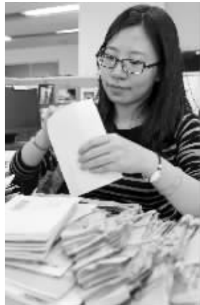
记者正忙着清点纸质选票