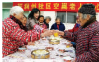
老人们在开心地吃“年夜饭”

“今天一大早,我们就忙起来了,买菜、拌饺子馅、烧菜、包饺子,大家都分好了工,就是要让老人们提前吃上一顿丰盛可口的‘年夜饭’。”正忙着烧菜的社区工作人员石春芳告诉记者,去年社区也为空巢老人烧了年夜饭,老人们吃得非常开心,“快过年了,帮空巢老人过个舒心年是我们的心愿。”