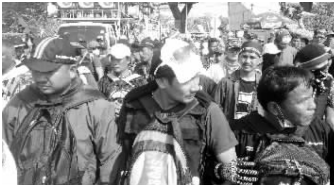
1月28日,曼谷陆军俱乐部外,示威者试图冲击会场

泰国看守政府副总理蓬贴28日在与选举委员会成员举行会议后宣布,2月2日大选将如期举行。