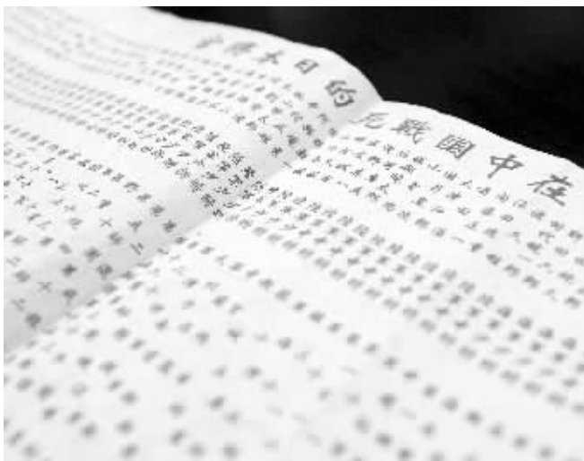
在中国被击毙的日本将官名单原件

现代快报记者了解到,侵华日军南京大屠杀遇难同胞纪念馆于1985年由南京市人民政府拨款修建,是全国第一家抗战类型的纪念馆,经1994年至1995年、2005年至2007年两次扩建后,形成展览集会区、遗址悼念区、和平公园区和馆藏交流区等4个功能区域。目前,每年前往参观的观众达600万人次左右。