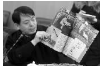
日本签署投降书时美国媒体出版的号外