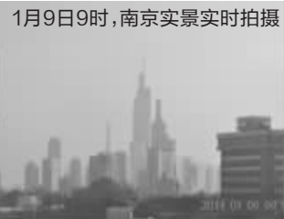
1月9日9时，南京实景实时拍摄

最近，有网友在南京某网站上发帖，贴出了2013年，每天在同一个地点拍摄的天空图。365张照片，一眼望去，清晰地展现出一年来的空气质量变化。现代快报记者了解到，这些照片实际并非拍的南京，是杭州网友拍摄的杭州一年的情况。不过，我们南京也有个这样的“天空拍摄记录者”，拍摄频率更高，一天24小时每小时一张。有兴趣的市民，登录南京市环保局网站就能看到。 现代快报记者 吴怡