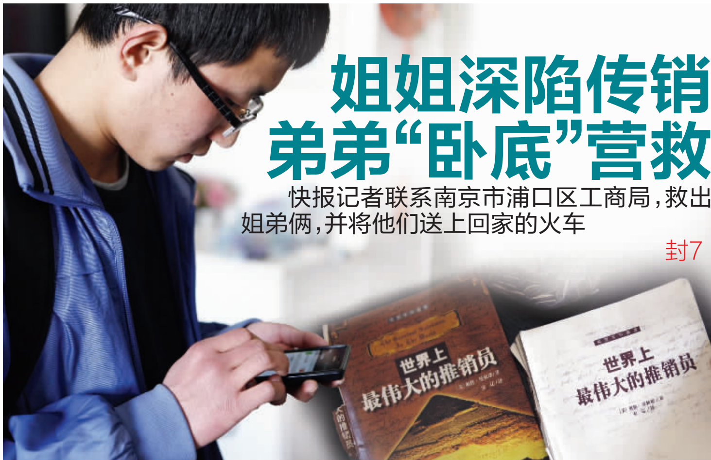
左图：虽然离开了传销组织，可弟弟仍然不放心姐姐，希望她能“回心转意” 右图：传销组织的教材