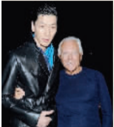
张亮与设计 Giorgio Armani先生