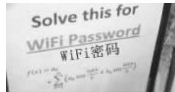
学渣只能费流量了