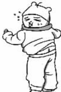
衣服太多影响身材