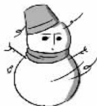
在室外长时间等人或等车