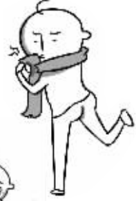
吃东西后衣服味道很重