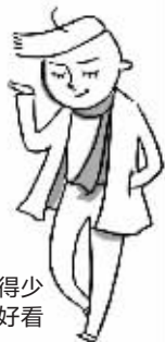
看到别人穿得少而且长得好看