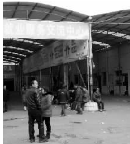
中午12点，空荡荡的安德门市场