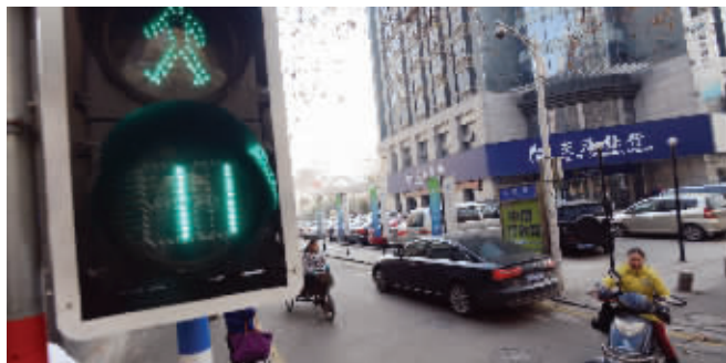
1月10日,八条巷路口安装了信号灯

近期,交警二大队在八条巷路口增设了行人过街信号灯,对中山南路南北向的车流干扰少了,通行效率也明显提高。