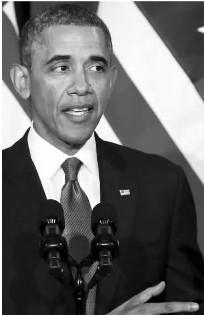
1月17日,在美国首都华盛顿,美国总统奥巴马在司法部就国家安全问题发表演讲

千呼万唤始出来。在“棱镜门”风波延宕7个月后,美国总统奥巴马17日公布了改革美国国家安全局对内、对外秘密情报监控行动的初步决定,包括改革对内电话监听项目、承诺不监听亲密盟友领导人等。分析人士认为,这些举措只是小处调整,未动真格,这样的改革恐难消除美国国内外的诸多担忧和质疑。