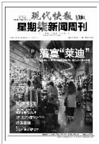
(上周星期柒新闻周刊封面)