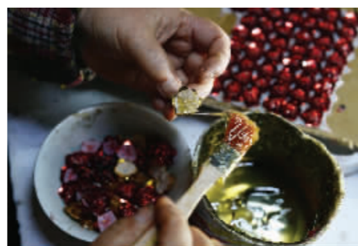
用粘胶粘贴马灯装饰品