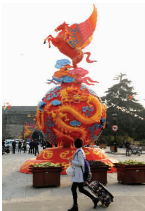
中华门瓮城的龙马灯