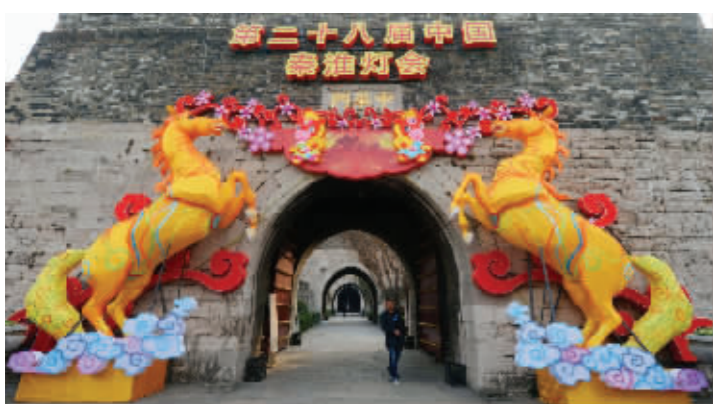
秦淮灯会的历史可以追溯到南朝

腊八过了就是年,传统的秦淮灯会也越来越近,马年当然看马灯,在中华门瓮城,就有一组天马行空的神马灯。飞鸟的脚下踏着一只金龙,寓意着龙马精神。