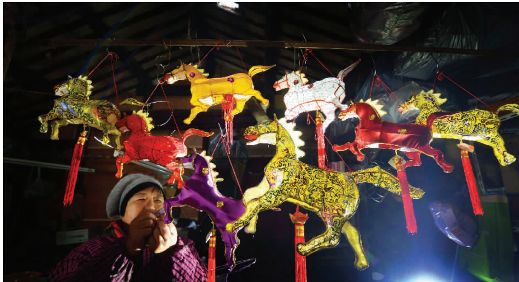
金陵曹家的“群马奔腾”花灯即将亮相