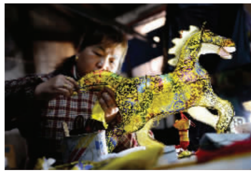
手工艺人正在赶制花灯