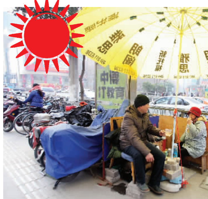
白天,是李大姐看车。每天下午,赵师傅要来送饭,顺便接班