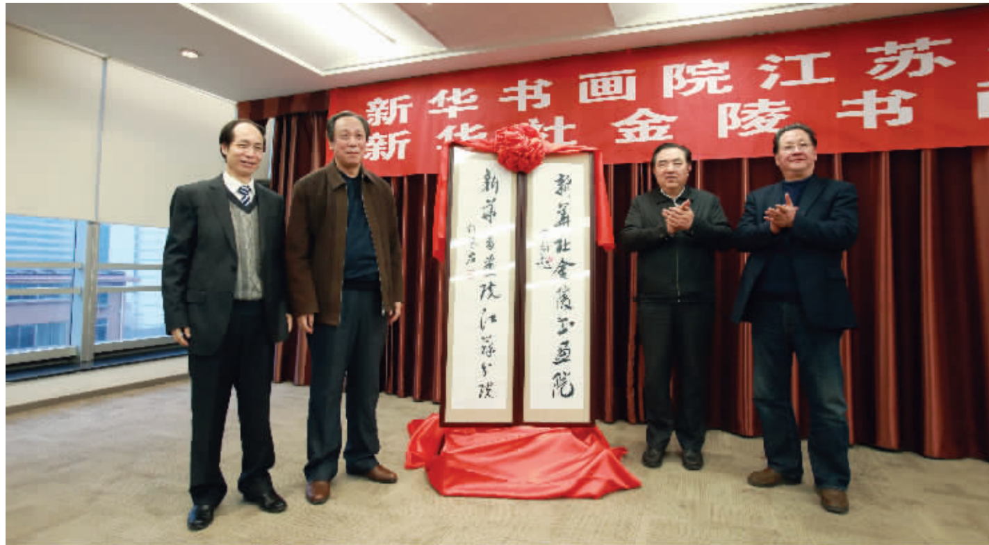
新华社江苏分社社长、新华书画院江苏分院暨新华社金陵书画院院长冯诚，新华社原副社长、新华书画院院长何东君，江苏省人大常委会原副主任丁解民，江苏省国画院名誉院长赵绪成(从左至右)共同为“两院”揭牌