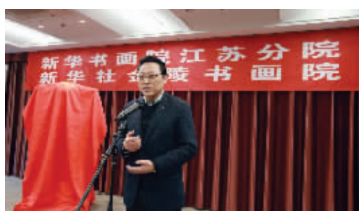
江苏省文化厅副厅长高云对“两院”的成立表示祝贺