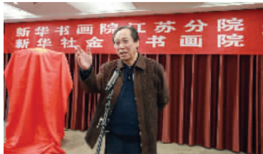
何东君对“两院”发展提出期望