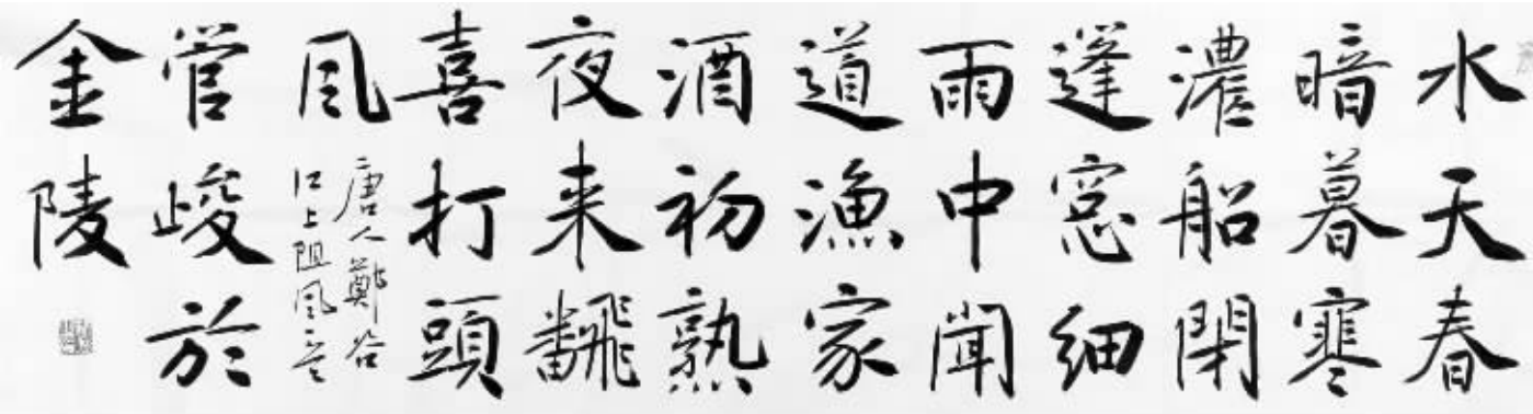
管峻《唐人郑谷江上阻风》