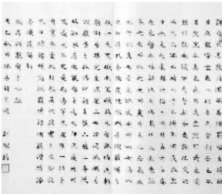
刘灿铭册页作品之一