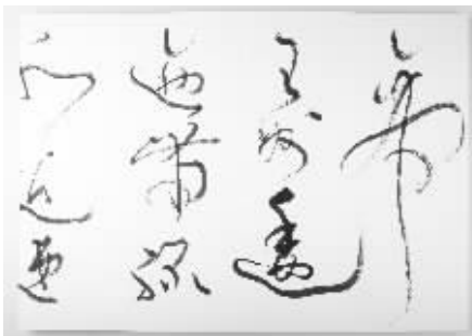
言恭达册页作品之一