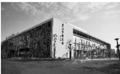
盐城市图书馆外景

艺加文投一直以来都在为打造艺术平台、提升江苏文化影响而努力。继艺+南通美术馆、艺+泰州美术馆、艺+常州美术馆、艺+无锡美术馆之后，本月20日，“艺+连锁美术馆”将再添新军——“艺+连锁美术馆盐城分馆”即将挂牌成立！ 实习生 杨於佳 现代快报记者 徐馨儿