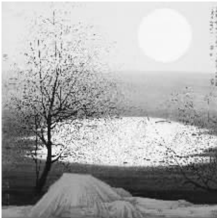
薛亮《月落鸟啼霜满天》