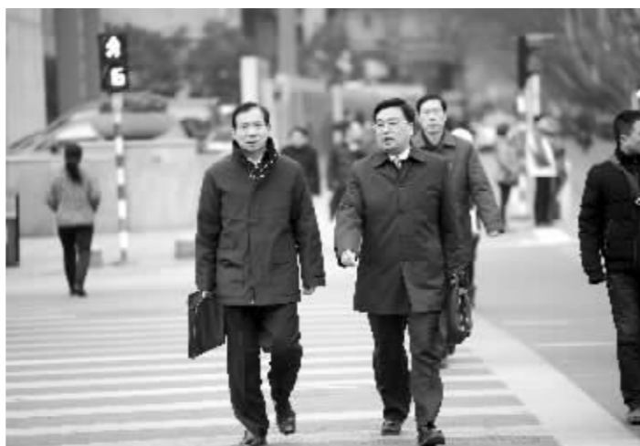
人大代表步行走到会场,以前逢大会必堵的长江路,昨天畅通多了