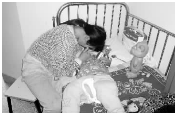
妈妈守着烁烁,不时亲吻安抚他

“绣花针能扎入这么深,确实少见,一般来说,即使不小心扎到孩子,也只会刺入皮下组织或者肌肉,但现在基本上整根针都插进了左肾。”小儿外科副主任医师黄岭竹说,从刺入的角度接近90度和深度来看,不排除人为刺入的可能,但这个需要警方调查。另外,医生