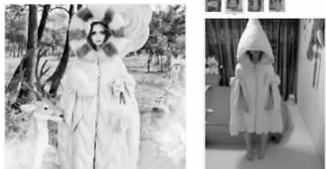
维多利亚时代的红小姐:我真心不是故意看到的……买家秀才是正片。 纯良英俊的笑了笑:哈哈一定是仇家派来的吧! (维多利亚时代的红小姐微博)

大满菌:看别的女生把男朋友的衣服穿身上,因为太大而松松垮垮,衣身太长遮住大半个身体,衣袖太长手指都没法露出来,感觉特别可爱又超有爱,于是你也想试试,就把男朋友的衣服往身上套,结果穿得比他还合身。