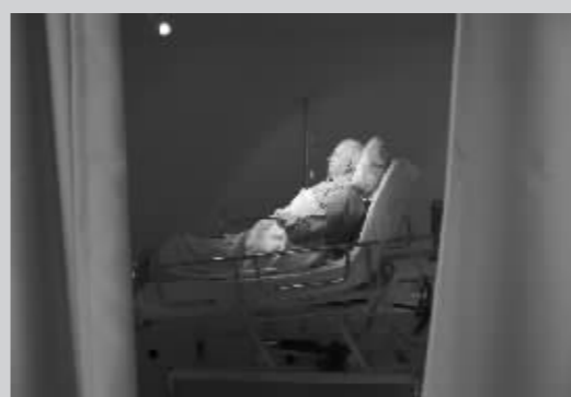
2006年，沙龙二次中风昏迷。（图为2010年10月18日，一件再现病床上昏迷的沙龙的艺术作品）