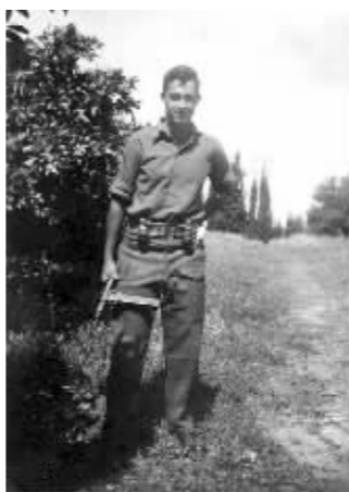
1948年，阿以第一次战争期间的沙龙，20岁，任步兵连长

1945年，沙龙作为未来犹太军队军官的培育对象，开始接受正规的军事训练。1947年，沙龙成为“哈加纳”组织的教导员，负责犹太定居点和集体农庄的安全保卫工作。