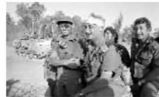
1973年10月，第四次中东战争期间，沙龙与摩西·达扬在苏伊士运河西岸

1982年6月，在沙龙的极力主张下，以色列大举入侵黎巴嫩。在此之前，沙龙亲自秘密访问贝鲁特，对每一条街道、每个重要的建筑物都进行了观察。1982年9月，在以军的默许下，黎巴嫩基督教民兵组织进入贝鲁特附近的巴勒斯坦难民营，屠杀了1500名巴难民。这一惨案震惊了世界。1983年，以色列议会调查委员会经过调查，认为身为国防部长的沙龙对巴勒斯