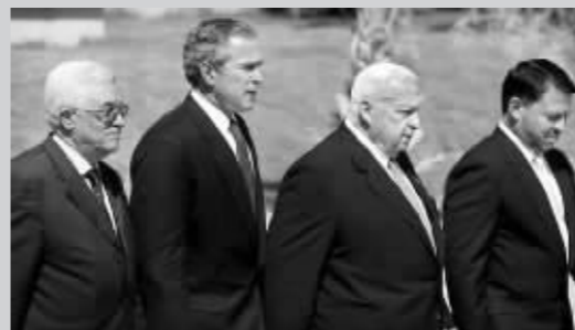
2003年6月，沙龙与阿巴斯、小布什和约旦国王阿卜杜拉二世参加美以巴三方峰会