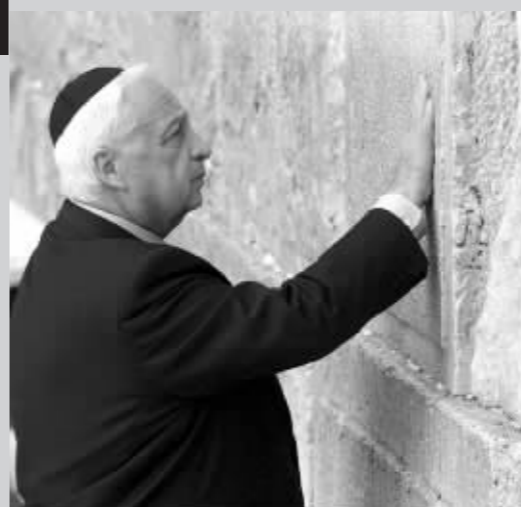
2001年2月7日，当选以色列总理沙龙在耶路撒冷旧城内的哭墙边祈祷