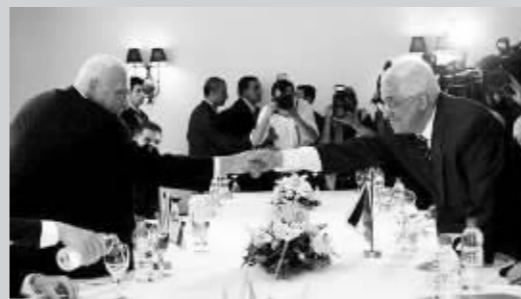
2005年2月8日，沙龙与阿巴斯达成停火共识