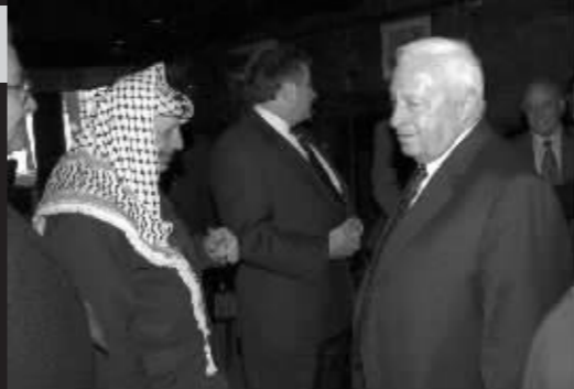
1998年，一次会议上，沙龙与阿拉法特相顾无言