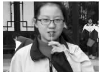
希望大家多留心,帮忙找找她

平时乖巧懂事的女儿竟然离家出走了,作家爸爸以为女儿只是周末去见网友,但是女儿的手机却关机了,报警后调出女儿的通话记录发现,女儿这段时间经常跟外地的招聘单位通话。作家爸爸这才意识到,女儿是要瞒着家里外出打工为自己还债。 现代快报记者 王冬艳