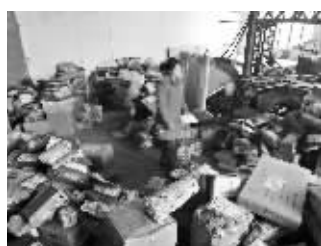
昨天,数千件包裹仍积压在仓库中

转让手续前,他曾经和所有快递员有过沟通,并且双方谈拢快递员的待遇在更换老板之后,仍然不变。可是1月6日当天快递员们再也联系不上了。朱先生认为,他可能被原先的老板和快递员们欺骗了,此后他赶紧拨打了110报警。如今朱先生只能发动家中的亲戚和朋友来帮忙,他自己也是亲自上阵,从早忙到晚。朱先生表示,他会尽全力,争取在两三天内将积压的包裹派送完。