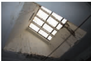
扬子饭店内部房顶

1929年，国民政府举行奉安大典，扬子饭店成为招待各国专使的定点饭店。1933年，宋庆龄女士下榻扬子饭店，营救牛兰夫妇，行政院院长汪精卫、司法部部长罗文干赴扬子饭店拜望宋庆龄，扬子饭店因此名噪一时。1968年，扬子饭店经上海市高级人民法院判决，成为绝产，由南京市房管局接收，后来成原下关区公安分局办公地点。