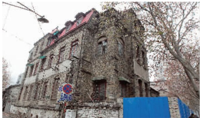
即将修缮的扬子饭店旧址