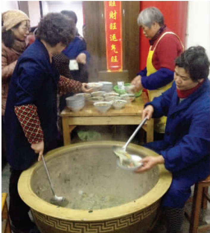
志愿者大妈们在分粥