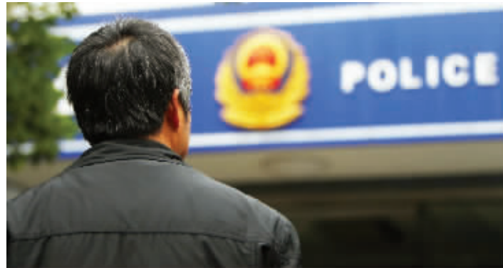
老康抓贼经验很丰富

一对“毒鸳鸯”结伴偷电瓶,被民警发现,女的落网男的逃脱。没想到,男的放心不下女友,偷偷到派出所打探消息,被50多岁的保安老康发现后,他赶紧逃。老康立即追了上去,眼看就要追上了,小偷竟然拿出一把菜刀向他砍去。搏斗中,老康下巴被砍伤,不过他夺下刀子继续追。增援的警力赶到后,把小偷围堵在桥上。小偷竟跳河试图游泳逃脱,但水太浅。由于天冷,20多分钟后,小偷冻得受不了,上岸束手就擒。 通讯员 秦公轩 现代快报记者 陶维洲/文