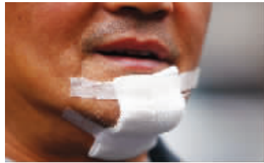
老康的下巴受了伤

一对“毒鸳鸯”结伴偷电瓶,被民警发现,女的落网男的逃脱。没想到,男的放心不下女友,偷偷到派出所打探消息,被50多岁的保安老康发现后,他赶紧逃。老康立即追了上去,眼看就要追上了,小偷竟然拿出一把菜刀向他砍去。搏斗中,老康下巴被砍伤,不过他夺下刀子继续追。增援的警力赶到后,把小偷围堵在桥上。小偷竟跳河试图游泳逃脱,但水太浅。由于天冷,20多分钟后,小偷冻得受不了,上岸束手就擒。 通讯员 秦公轩 现代快报记者 陶维洲/文